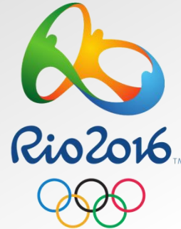
Giochi Olimpici 2016 di Rio